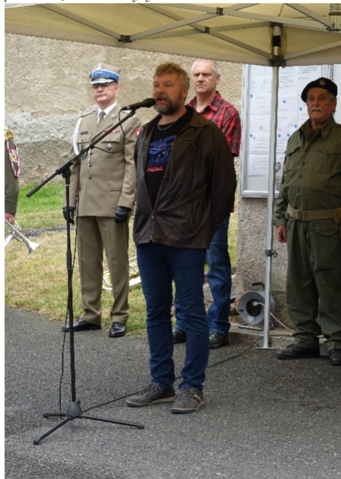
Za KVH Otaslavice a Obec Otaslavice jsem pronesl pár slov o naší činnosti a projektu "Pocta Českému čtyřlístku".