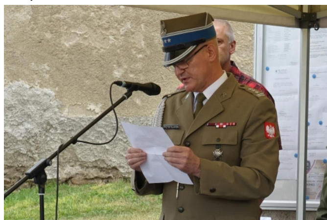
Vojenský a letecký přídělnec Polské republiky v Praze, plukovník Jaroslaw Przybyslawski